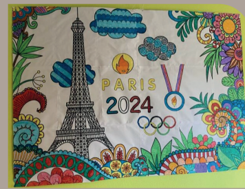
Fresque réalisée par les enfants sur les temps périscolaires