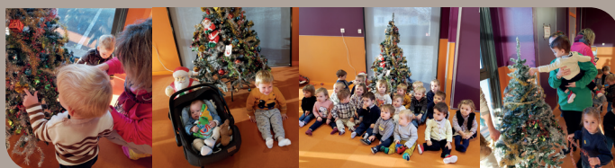
En attendant l'arrivée du père Noël, les bambins de la planète bout'chou ont décoré leur sapin. Belle réalisation