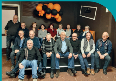
Sortie bowling pour une vingtaine d'adhérents

Le programme établi pour 2024 laisse entrevoir de belles sorties : échappées en bord de mer, escapade à Paris en mai, mais également théâtre, randonnées dans les vignes, une journée golfe du Morbihan en septembre et plein d'autres activités tout au long de l'année.