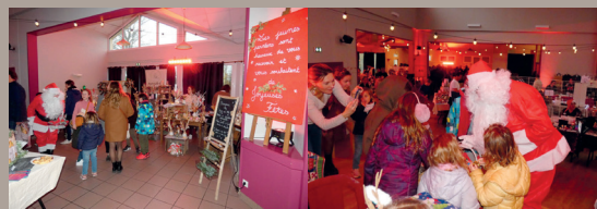
Au marché de Noël, dimanche 10 décembre