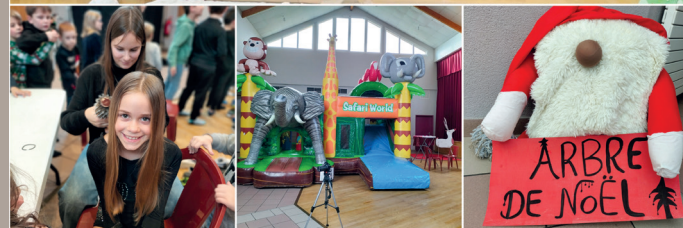
Au centre de loisirs – mercredi 13 décembre