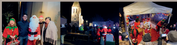
Pour la mise en lumière – samedi 09 décembre

Le père Noël a encore pris le temps cette année de venir à la rencontre de nos petits parnéens ! Il a fait quelques apparitions tout au long du mois de décembre. Nous le remercions pour ce temps passé, pour les pauses photos accordées aux enfants et aux plus grands, et surtout pour les cadeaux et sucreries qu'il a apportés dans sa hotte !