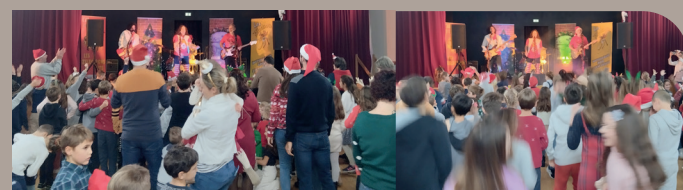
École - Jeudi 21 décembre, le père Noël est venu accompagné d'un groupe de Rock «les Zélectrons Frits» pour un concert dédié aux enfants dans la salle des Chardonnerets